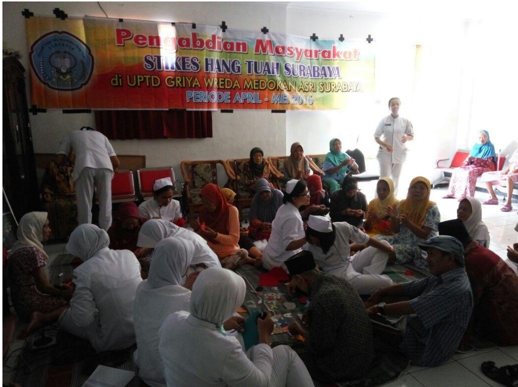
Lampiran 2 : Dokumentasi Kegiatan Pengabdian Masyarakat